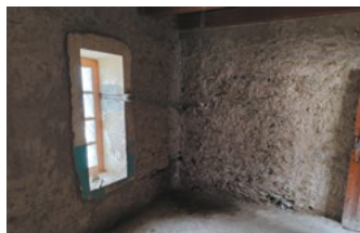
Cuisine : rénovation des murs