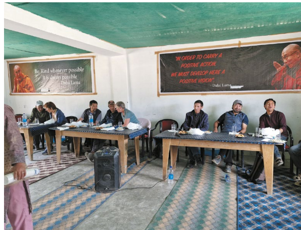
Élection du nouveau Managing Committee en juillet

Pour préparer cette transition, nous avons collaboré étroitement avec le Président des parents d'élèves et le Président de l'association des anciens élèves de l'école.