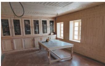
Travaux terminés de la bibliothèque