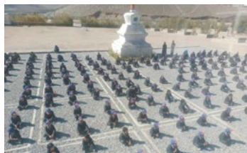
Rénovation du Prayer ground