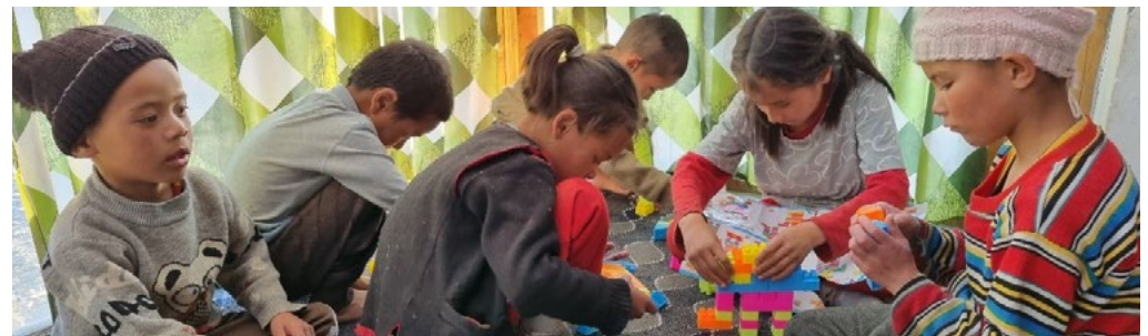
Figure 19 : construction en Légo