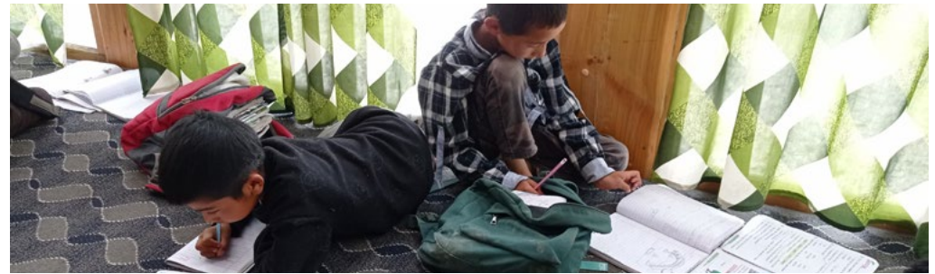
Figure 17 : home work