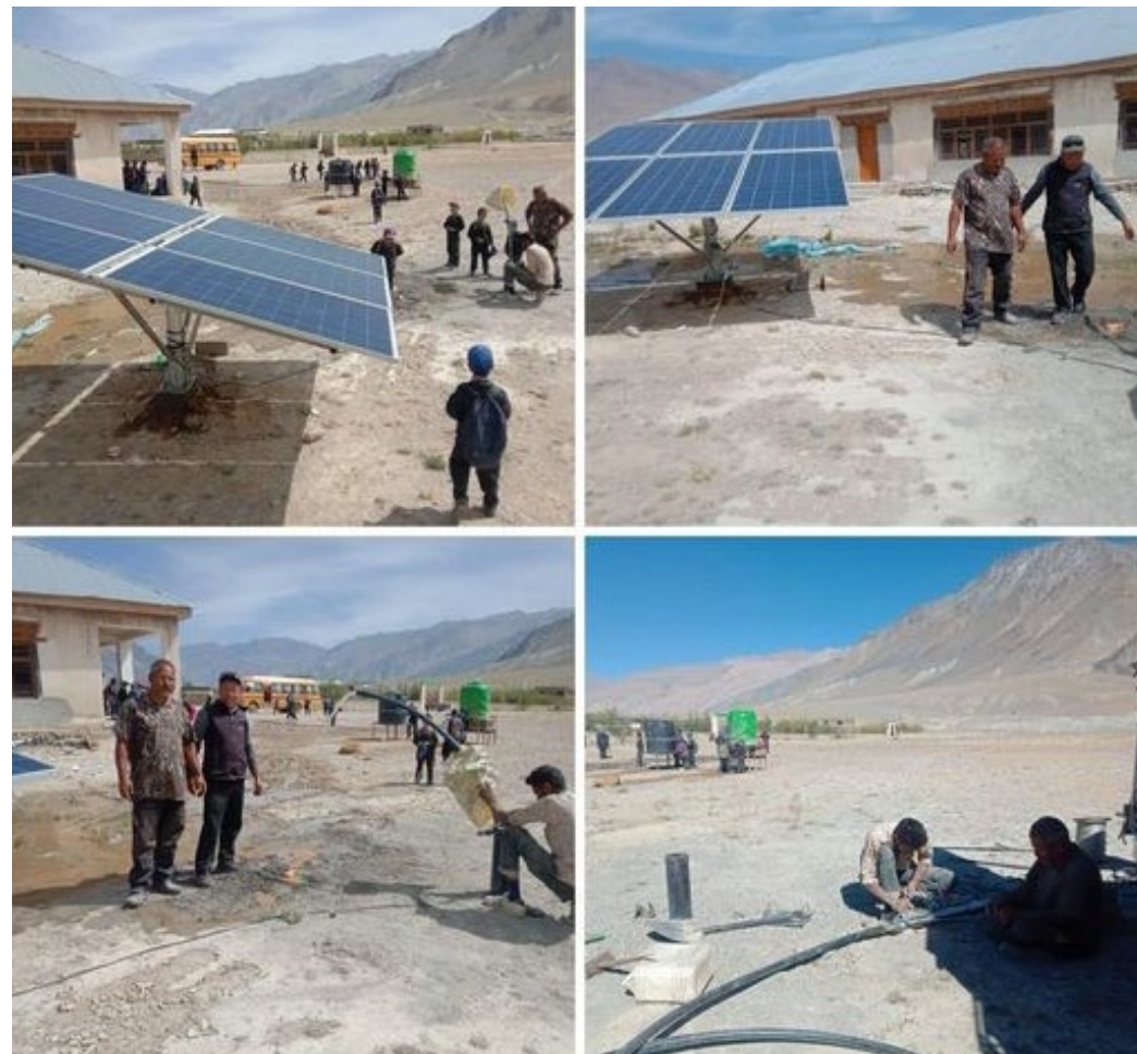
Figure 23 : nouvelle pompe solaire

Le gouvernement continue sa campagne de forage pour puiser l'eau grâce à des pompes solaires. Thinley a su contacter les bonnes personnes pour que la LMHS puisse bénéficier d'un forage près du multipurpose hall. Ce nouvel équipement a été financé par l'Union Territoriale du Ladakh.