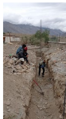
Figure 21 : fondations juillet 2023