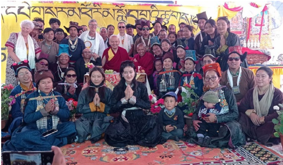
Figure 26 : Le Rinpoche avec le staff de l'école et les membres présents d'AAZ.

« Lharampa » est la contraction de « Lhadèn raptchampa », « docteur de Lhasa ». La tradition remonte au 1er Panchen lama, Losang Tcheukyi Gyèltsèn (1570-1662), réincarnation du fameux Énsapa Losang Döndroup et tuteur du 5 ème Dalai-lama qu'il reconnut en 1622.