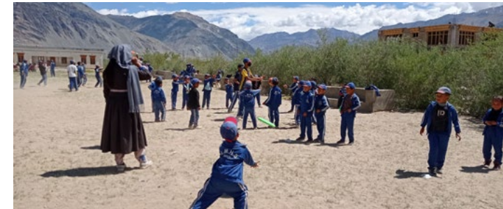
Figure 11 : atelier frisbee classe primaire