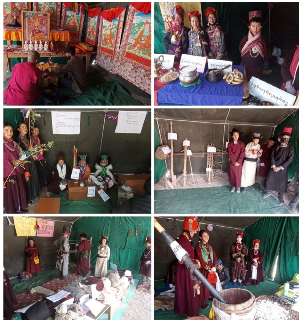
Figure 25 : stands culture traditionnelle

Six thèmes ont été retenus : le bouddhisme, l'alimentation, le mariage, l'agriculture, la laine de yacks et la doxa (alpage d'été pour les bêtes).