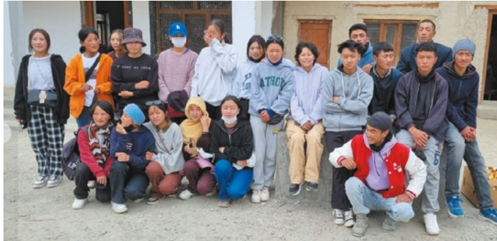
Figure 3 : 21 des 33 élèves de classe X- promotion 2022-2023

Tous les étudiants de la classe X ont réussi leurs examens.