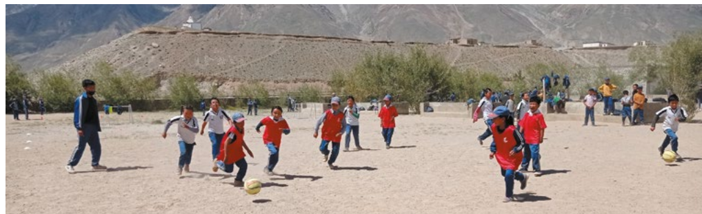
Figure 8 : atelier maitrise du ballon au pied