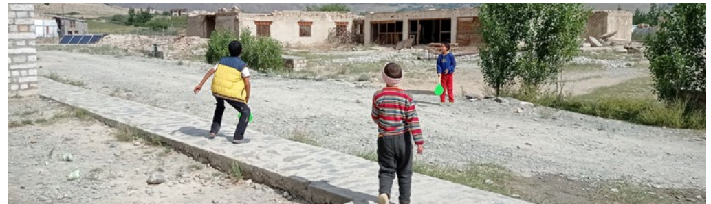
Figure 18 : jeux de raquettes