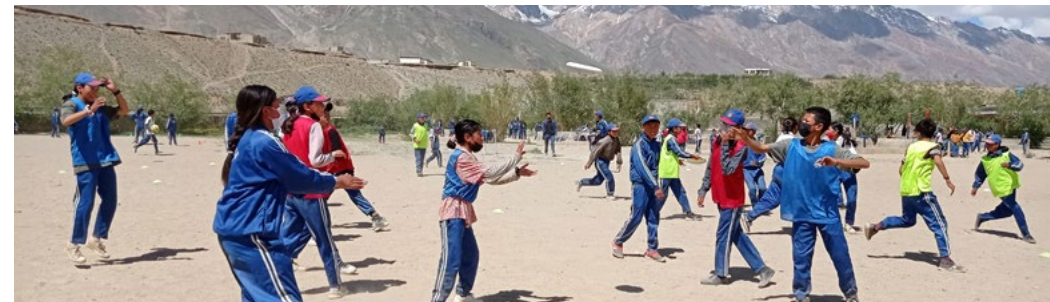
Figure 13 : atelier frisbee classes secondaires