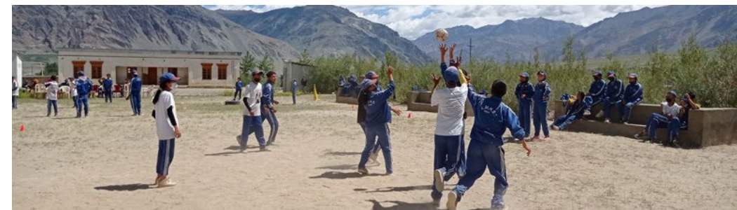
Figure 12 : atelier maitrise du ballon