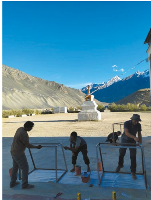
Figure 6 : tout le monde à la peinture