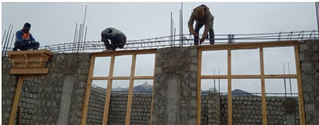
Figure 20 : laboratoire septembre 2023

Le Babu nous affirme que l'hiver n'impactera pas la construction même si elle n'est pas couverte.