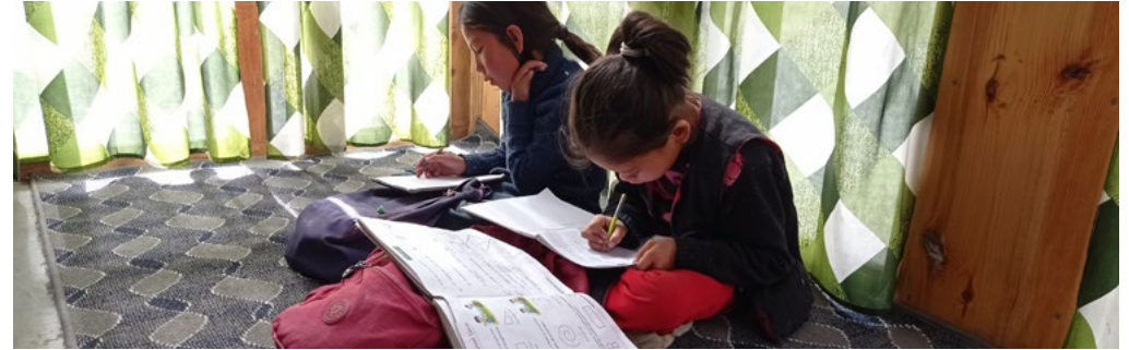
Figure 16 : home work