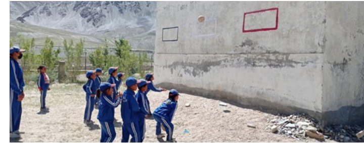
Figure 10 : atteindre la cible