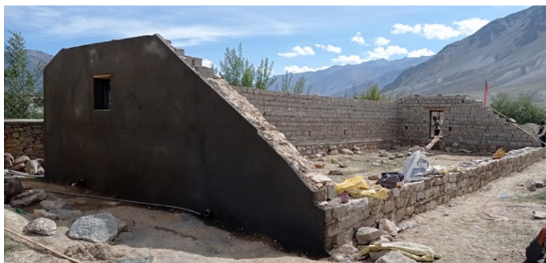
Figure 22 : serre -work in progress