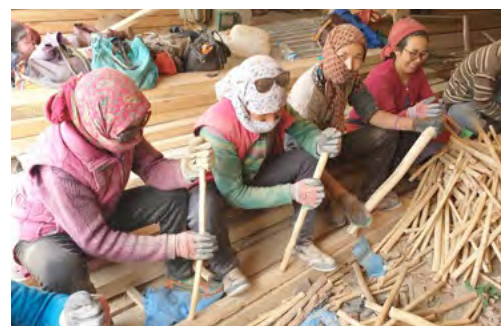
Préparation des tallus par les parents d'élèves