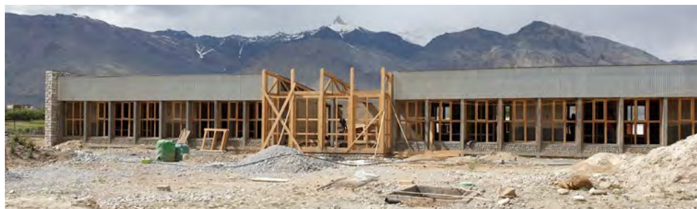
RBP Façade sud le 16 juillet 2019