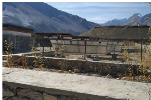
Clôtures posées autour des panneaux photovoltaïques des pompes et du RBP