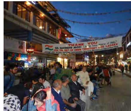
Une banderole à Leh pour remercier l'action des politiques sur le territoire du Ladakh.