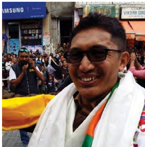
Le député Jamyang Tsering Namgyal

La nouvelle est diversement appréciée par la population, les zanskaras sont contents, les musulmans du zanskar très réservés voire hostiles. Mais ils sont tous dans l'attente des conséquences pratiques sur la vie quotidienne. Une fête de remerciement à Jamyang Tsering Namgyal , le nouveau député au parlement central de Delhi, a été organisée à Leh. Agé de 34 ans, c'est le plus jeune député d'Inde. Très charismatique, il semble apprécié par les Ladakhis.