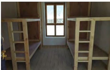
Les lits sont installés mais la moquette n'a pas encore été posée