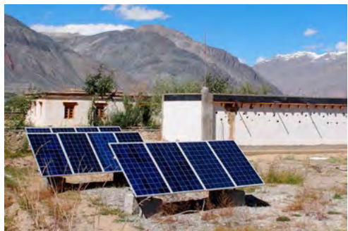
Les panneaux photovoltaïques et la salle des batteries

Les panneaux photovoltaïques ont été installés dans l'enceinte du NBP et un local batterie a été créé dans une partie des anciennes toilettes du NBP (new building project).