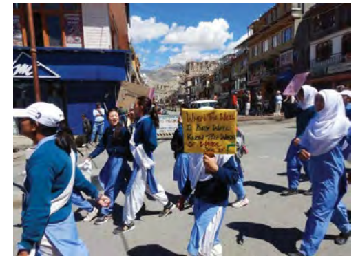
Lors de la manif. des lycéens pour sauvegarder l'eau

Information de toute dernière minute. La première élection du nouveau territoire du Ladakh a été remportée par le représentant du BJP , parti de Narendra Modi actuel premier Ministre, Stanzin Chospel . Il est donc le nouveau councilor de la circonscription de Martselang au conseil de développement de la région autonome du Leh.