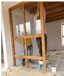
Pose des vitrages extérieurs ((juillet 2019)