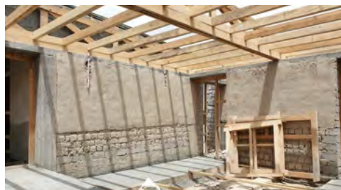
Salle commune- passage cimenté