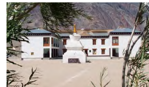
Le bâtiment principal « Main Building »

Merci à Jean Pierre VANDELLE d'avoir assuré des travaux de maintenance, à la fois dans le bâtiment principal (consolider les pupitres des élèves des grandes classes), remplacement d'une porte des toilettes, et dans le NBP revisser correctement des fenêtres.