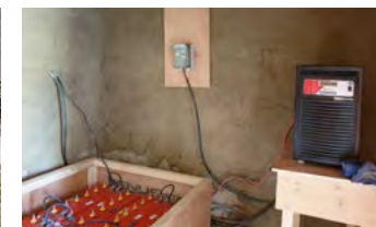
Salle des batteries (anciennes toilettes du NBP)

La salle de bain (une douche pour les garçons, une douche pour les filles) a été équipée d'un chauffe-eau solaire.