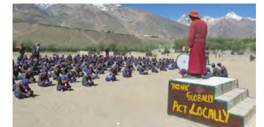
Le Gese lors de la « Morning Assembly »