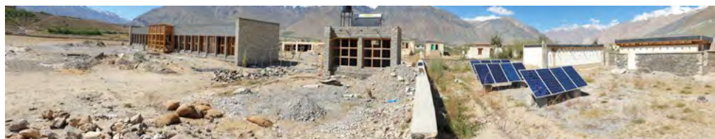
Vue panoramique du RBP - juillet 2019

Malgré tout, nous avons essayé, en fonction soit des factures déjà enregistrées soit des devis ou des prix connus, d'établir un budget qui n'est pas définitif bien sûr !