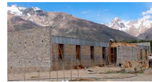
RBP Façade Nord le 18 juillet 2019