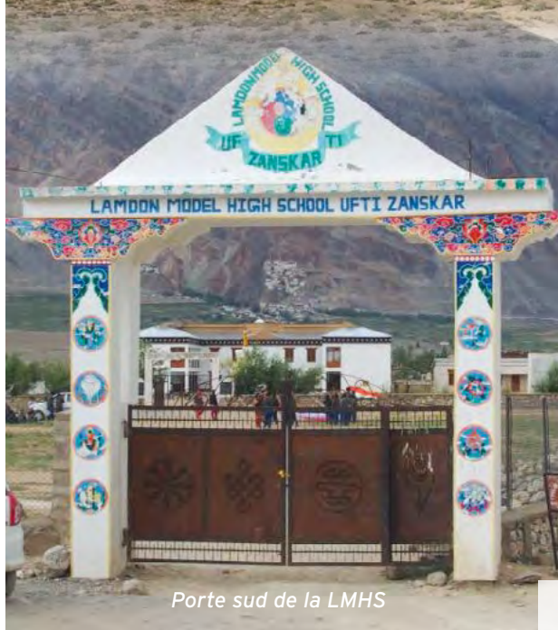
Porte sud de la LMHS