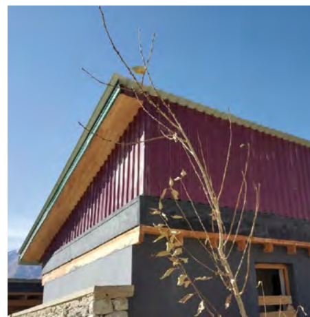
Toit de la salle des batteries protégé par des tôles Passage central du RBP