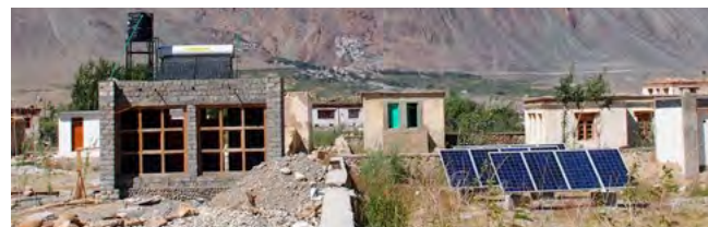
La salle de bain et chauffage solaire (juillet)