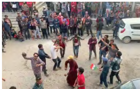
A Padum, les Zanskaras dansent pour célébrer l'UT