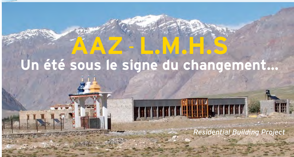
Residential Building Project