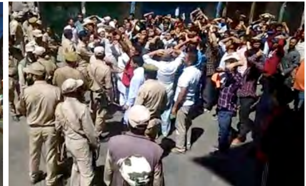
A Kargil, les jours qui ont suivi la modification de la constitution, manifestations des musulmans contre l'UT.

Avec toutes ces modifications, une nouveauté émerge: tout Indien quel qu'il soit peut désormais investir dans la région. Y aura-t-il un rush des investisseurs indiens lié au développement du tourisme indien dans la région ? Le Ladakh et le Zaskar sont déjà dans un programme de construction d'hôtels et de guest houses qui laisse interrogateur. Le développement doit-il passer essentiellement par le tourisme ? Autant de questions auxquelles il est difficile de répondre aujourd'hui.